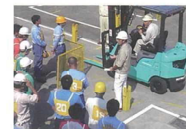
フォークリフト実技講習