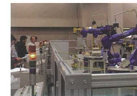
産業用ロボット実技講習