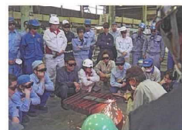
ガス溶接実技講習